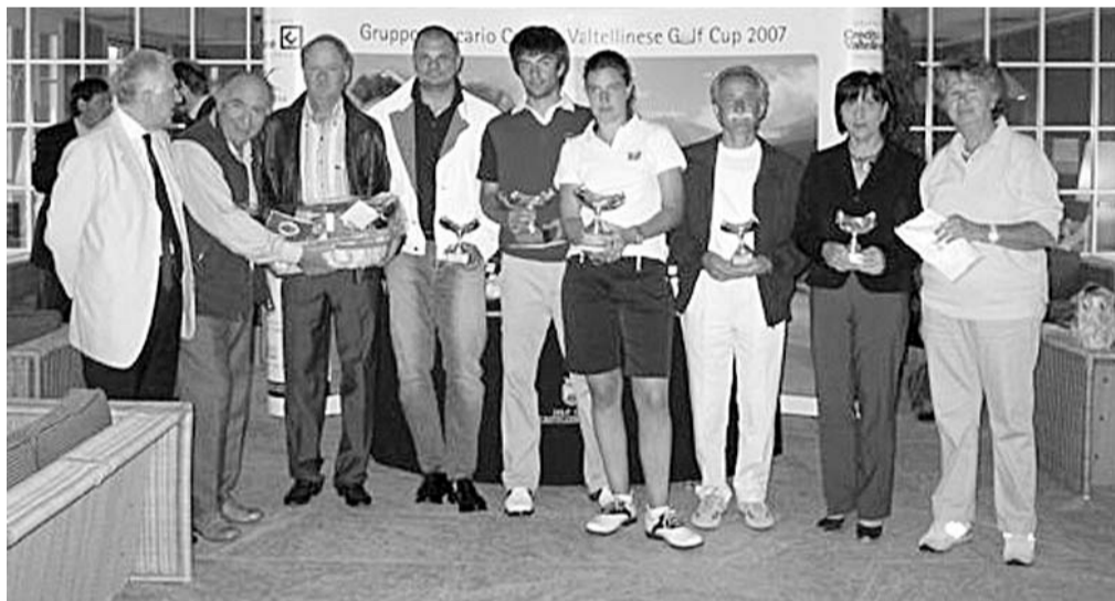
Un momento della premiazione dei vincitori del torneo al Golf club di Agrate Conturbia

AGRATE CONTURBIA (stg) Domenica 13 maggio tappa piemontese per la Gruppo bancario credito valtellinese golf cup, torneo che, giunto alla quarta edizione, si propone di promuovere natura, prodotti, cultura e tradizioni della Valtellina. È stato infatti il Golf club Casteconturbia di Agrate Conturbia a ospitare la terza tappa del torneo. La manifestazione, promossa dal Gruppo Creval che nei prossimi mesi aprirà quattro filiali nella provincia di Novara, è nata dalla convinzione che il golf rappresenti un veicolo qualificato e idoneo a far conoscere la cultura, i sapori e l'ospitalità della Valtellina attraverso la promozione sul cam-