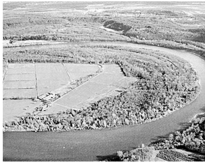
Una veduta aerea dell'area Casone - Montelame

POMBIA L'esposizione sarà visitabile fino al 20