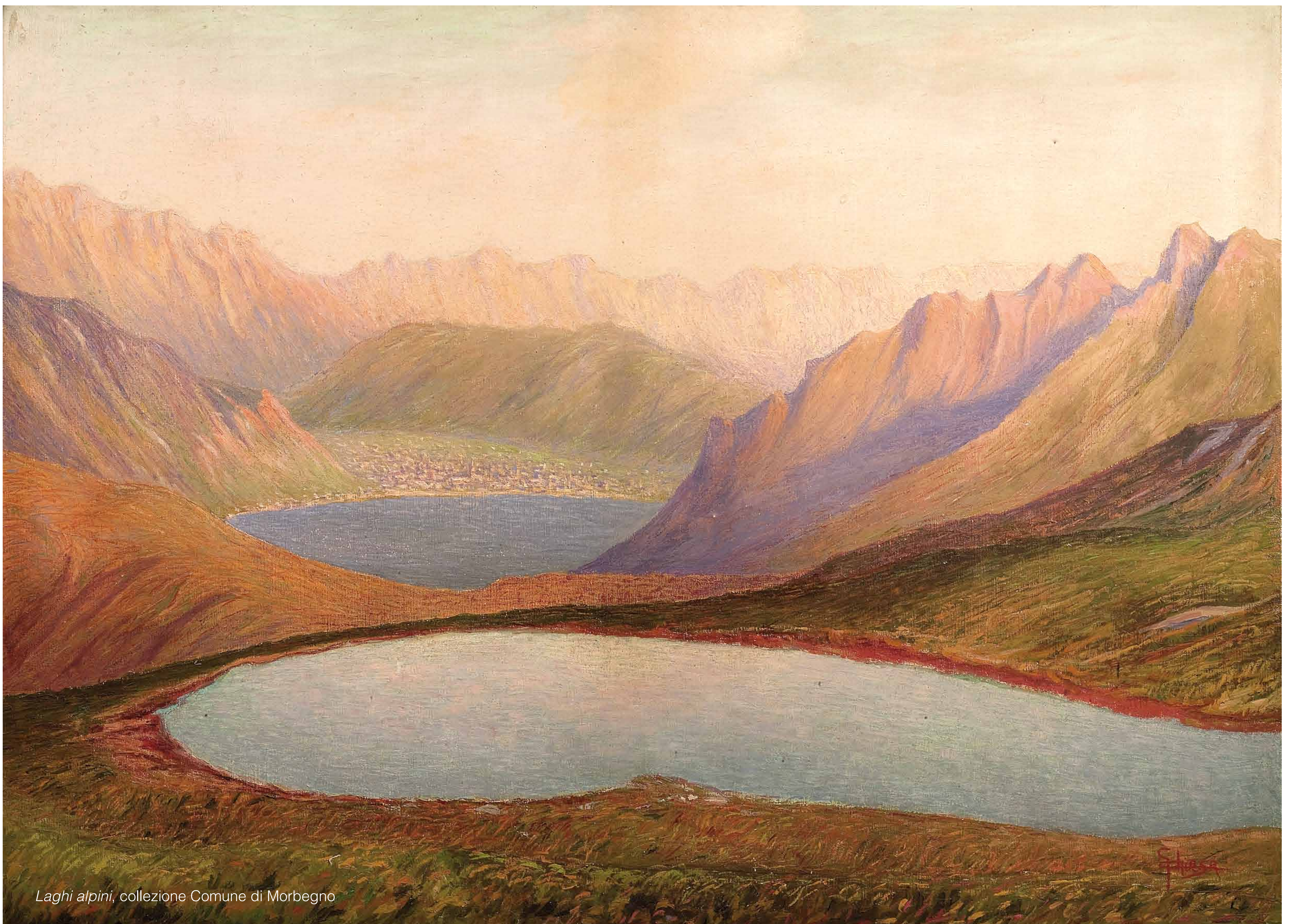
Laghi alpini, collezione Comune di Morbegno

Tutti i giorni 15.30/18.30, sabato e domenica 10.00/12.00 - 15.30/18.30 Lunedì chiuso