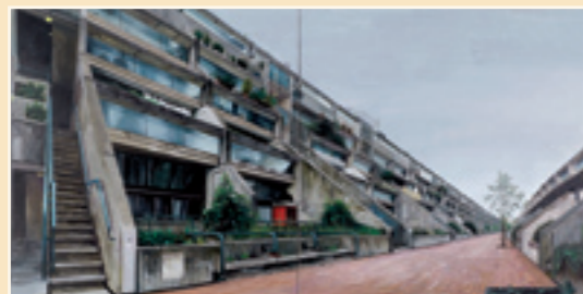
Les Grandes Terres Agosto 2008 Olio su tela 240 x 240 cm