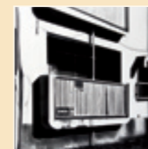
Immeuble à Roppongi Gennaio 2009 Grafite su carta 79 x 109 cm