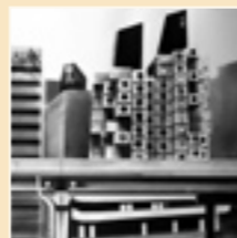
Immeuble à Kitagata (2) Marzo 2009 Grafite su carta 79 x 109 cm