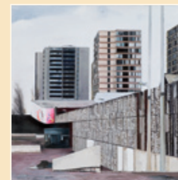
Dalle de Bobigny Magic Cinema Giugno 2009 Olio su tela 150 x 150 cm