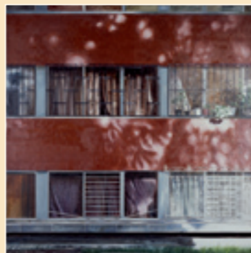
Unité d'Habitation Nonoalco-Tlatelolco Settembre 2001 Olio su tela 240 x 240 cm