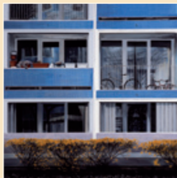
Immeuble à Sucy-en-Brie Giugno 2008 Olio su tela 240 x 240 cm