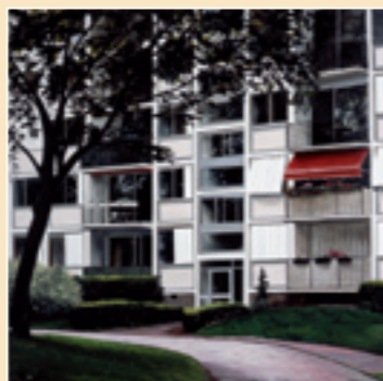
Paysage à Sapporo Settembre 2009 Olio su tela 200 x 200 cm